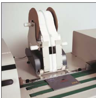
Optional hanger feeder Opcional dispensador de colgadores Optionnel : Distributeur de crochets Plug and play Aufhänger-Zufuhr