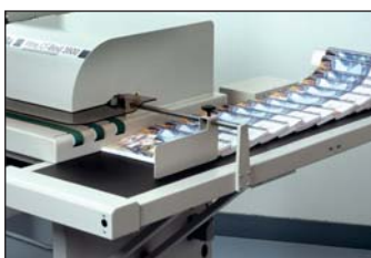
Reception of the books / Recepción de libros / Réception des ouvrages / Aufnahme der Büchern