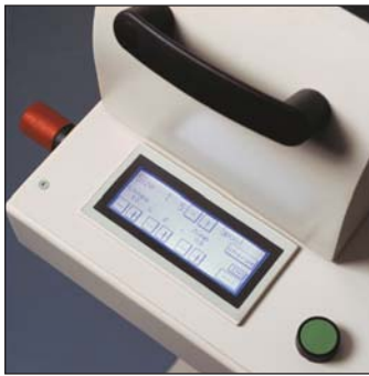
Easy to use touch screen Utilización fácil de la pantalla táctil Ecran de contrôle digital facile d'utilisation Einfache Touch-Screen-Steuerung