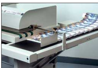
Reception of the books / Recepción de libros / Réception des ouvrages / Aufnahme der Büchern