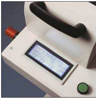
Easy to use touch screen Utilización fácil de la pantalla táctil Ecran de contrôle digital facile d'utilisation Einfache Touch-Screen-Steuerung